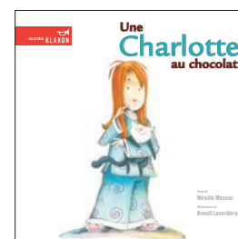
Une Charlotte au chocolat

Contacts de presse : Mireille Bertrand au 418-828-0481/ mireillebertrand@sympatico.ca ou Virginie Perron au 450-933-3496/ v.perron@videotron.qc.ca